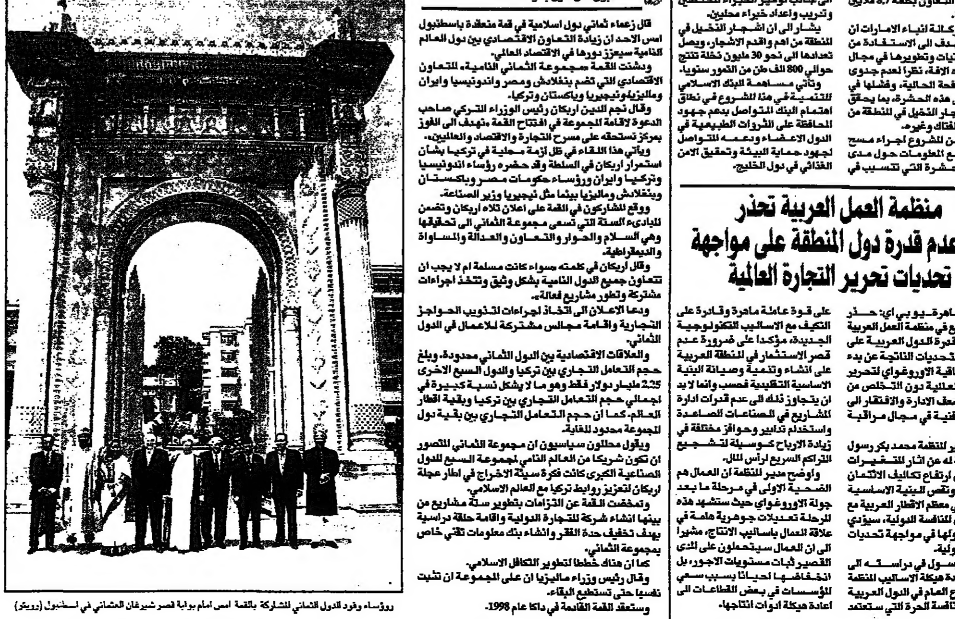
رؤساء وفد الدول الثماني للشراكة بالتمه اسم بامه يومه قصر شيرخان الشمالي في استنبول

مملكة العمل العربية تحذر. تحذر منظمة العمل العربية من عدم قدرة دول المنطقة على مواجهة تحديات تحرير التجارة العالمية، وتطالب بتعزيز التعاون الاقتصادي بين الدول الأعضاء. وتعد منظمة العمل العربية من المنظمات التي تسعى لتعزيز التعاون الاقتصادي في المنطقة، وتعد تحذر من عدم قدرة دول المنطقة على مواجهة تحديات تحرير التجارة العالمية من الخطوات المهمة في هذا الاتجاه. وتعد منظمة العمل العربية من المنظمات التي تسعى لتعزيز التعاون الاقتصادي في المنطقة، وتعد تحذر من عدم قدرة دول المنطقة على مواجهة تحديات تحرير التجارة العالمية من الخطوات المهمة في هذا الاتجاه.